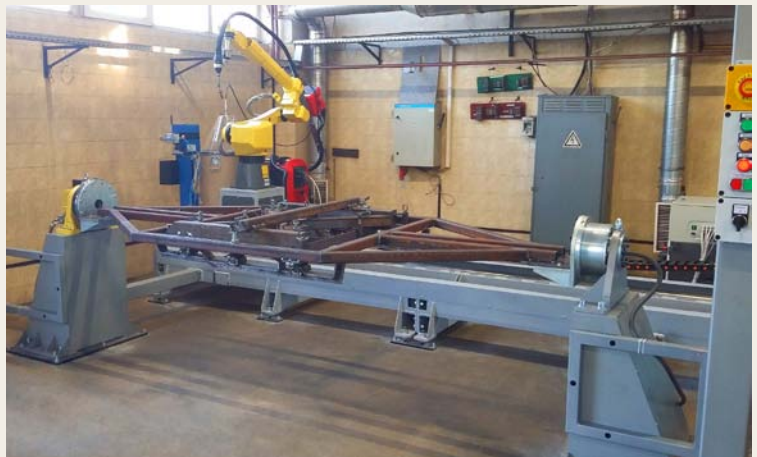
↑ Рис. 4. Комплекс РК759-2; поставлен на ЧАО «Богуславская сельхозтехника», г. Богуслав, Киевская обл.