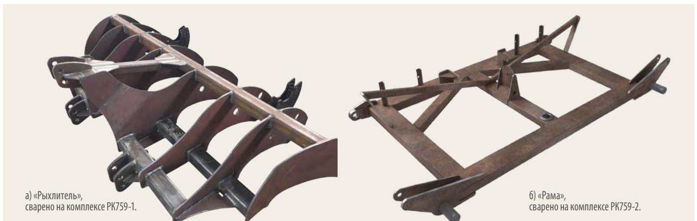
➤ Рис. 1. Примеры металлоконструкций сельхозтехники