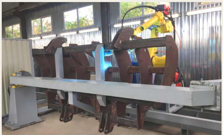
↑ Рис. 3. Комплекс РК759-1; поставлен на ЧП «ПАЛАНДИН-АГРО», г. Балта, Одесская обл.